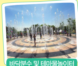
바닥분수 및 테마물놀이터